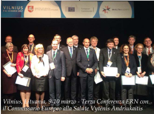
Vilnius, Lituania, 9-10 marzo - Terza Conferenza ERN con il Commissario Europeo alla Salute Vytenis Andriukaitis

La rete sulle malattie rare ortopediche BOND (Rare Bone Diseases) è coordinata dal dottor Luca Sangiorgi, responsabile della Genetica Medica del Rizzoli. BOND riunisce tutte le malattie rare, essenzialmente congenite, croniche e di origine genetica, che colpiscono cartilagine, ossa e dentina. BOND punta a stabilire percorsi diagnostico/terapeutici specifici al fine di realizzare un sistema integrato europeo che sappia compensare gli squilibri tuttora presenti e che favorisca la presa in carico del paziente secondo i protocolli più aggiornati nella sede più prossima alla propria residenza. In sintesi, ci si predispone a fare "viaggiare" le informazioni e le competenze e limitare il trasferimento dei pazienti solo a quei casi in cui possano beneficiare di una terapia altamente specializzata disponibile esclusivamente in uno dei centri partecipanti al network.